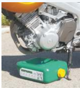
Ingombro ridotto per l'utilizzo su auto e moto