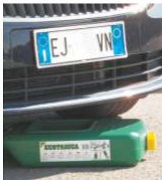
L'ampiezza dell'incavo centrale garantisce un facile recupero