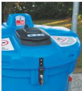
Portato nelle apposite stazioni di raccolta o isole ecologiche

Tappo di chiusura del foro centrale da applicare una volta riempita la tanica