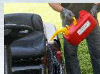
L'erogatore a soffietto inclinato, facilita il riempimento di qualsiasi serbatoio (auto, moto e mezzi per il giardinaggio)