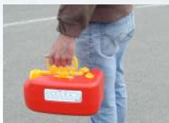
La maniglia roteabile di 90° rende più facile il trasporto

6 Litri Cod.02520 10 Litri Cod.02530 Kit accessori Cod.02525