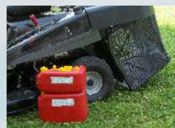
Impilabile per occupare meno spazio