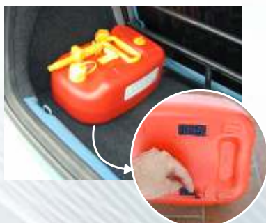
Poco ingombrante e sicura nel trasporto, dotata di due strisce di "velcro" che permettono di fare presa sulla moquette del baule impedendo gli spostamenti

Maniglia roteabile di 90° per facilitare il trasporto e le operazioni di versamento