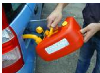
Estrema facilità nello svuotamento