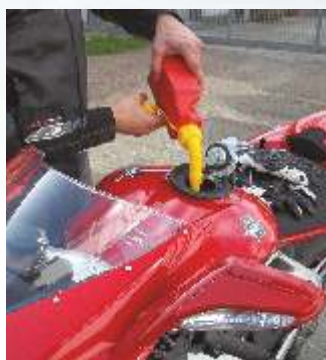
Dotata di prolunga a soffietto