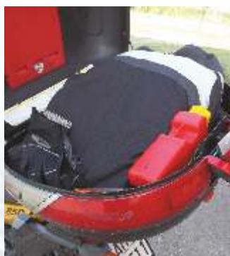
Le ridotte dimensioni ne permettono il posizionamento nel bauletto