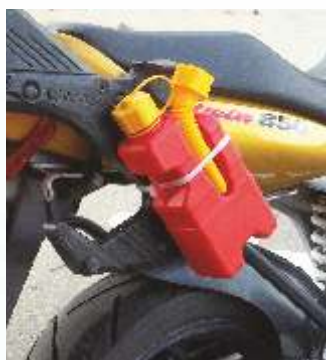
Può facilmente essere agganciata al telaio della moto